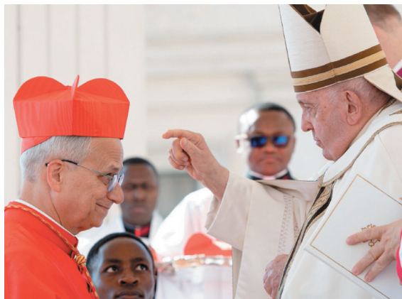
프란치스코 교황에게 추기경 서임을 받는 로버트 프랜시스 프레보스토 대주교

2013년 10월 시카고 관구로 돌아와 양성 책임자 겸 관구장 대리를 역임하였다. 2014년 11월 3일 프란치스코 교황에 의해 페루 치클라요 교구장 서리, 수파르의 명의 주교로 임명되었으며, 11월 7일 제임스 패트릭 그린 교황 대사가 참석한 가운데 교구장 서리로 취임하였다. 같은 해 12월 12일 과달루페의 복되신 동정 마리아 축일에 치클라요 교구 주교좌 성당에서 주교품을 받았고, 다음 해인 2015년 9월 26일 치클라요 교구장 주교로 임명되었다. 2018년 3월 페루 주교회의의 제2부의장으로 선출되었고, 2019년에 교황청 성직자성 위원, 2020년에 교황청 주교성 위원으로 임명되었다. 한편, 2020년 4월 15일에는 페루 카야오 교구장 서리로 임명되었다.