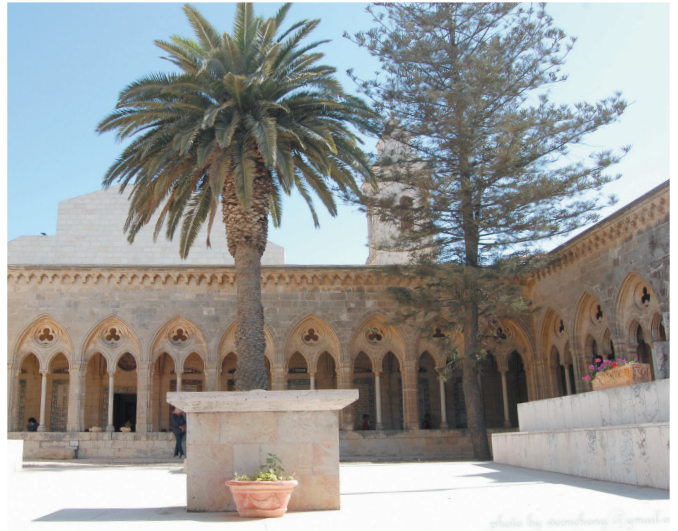
주님의 기도 성당

주님의 기도에는 “하늘에서와 같이 땅에서도 이루어지소서!”라는 구절이 나옵니다. 이는 옛 성전에도 적용되는 내용입니다. 왜냐하면, 이스라엘 백성은 예루살렘 성전을 하늘 성전의 모상으로 여겼기 때문입니다. 이는 이스라엘뿐 아니라 고대 근동인들이 비슷하게 공유한 신관으로서, 히브리서에서도 확인됩니다: “모세가 성막을 세우려고 할 때에..., 그들은 하늘에 있는 성소의 모상이며 그림자에 지나지 않는 성소에서 봉직합니다. 하느님께서 ‘자, 내가 이 산에서 너에게 보여준 모형에 따라 모든 것을 만들어라.’ 하고 말씀하신 것입니다”(8,5). 이에 따르면 모세는 광야에서 주님의 성막을 봉헌할 때, 주님께서 보여주시는 모형대로 지은 셈입니다(탈출 25,9). 이후 솔로몬이 봉헌한 예루살렘 성전 역시 하늘 성전(묵시 11,19)의 모상처럼 지어집니다. 이는 다윗이 아들 솔로몬에게 당부한 말에도 잘 나타납니다: “이 모든 것은 주님의 손으로 쓰인 기록에 들어 있다. 그분께서는 나에게 이(성전) 모형의 온갖 세부 사항을 분명히 알려 주셨다”(1역대 28,19).